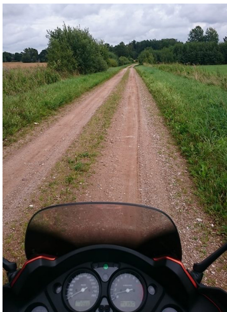
Avdelningen lättkörd grusväg.

jag köra grus. Vill jag köra på asfalt blir det stora vägar. Ni som gillar stora, raka vägar, hur håller ni er vakna? Jag lessnar och håller på att somna efter bara några mil.