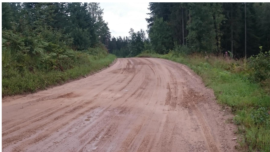
Här tog orken slut, men tur (och skicklighet?) höll i sig och många mil senare blev det asfalt igen.

Det är säkert jättekul att forsa fram i god fart på dessa vägar med nabbdäck som ger bra fäste. Jag tar alla grusfantasters ord på det.