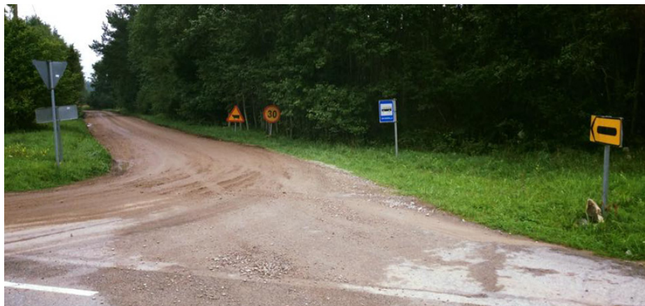
Bara några mil från färjan var vägen av stängd och pilarna pekade på resans första blöta sandväg.

Efter en natt på ön Saaremaa (Ösel) tog jag rakaste vägen till Pärnu. Regnet hängde i luften och behagade komma ner