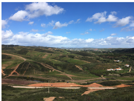
Delar av övningsområdet och landskapet.