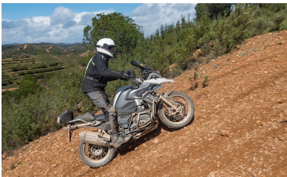
Undertecknad på väg uppför den omtalade "slalombacken". Brant och lång men tämligen slät. Dock ganska doserad på slutet som kunde ställa till det.