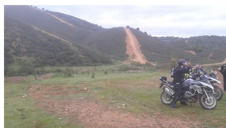
Ett av alla våra övningsområden.

Det var ca två mil dit och vi kommer till ett gigantiskt område med stigar och vägar upp- och nerför kullarna/bergen. Den plats dom brukar vara på kom vi inte in på idag då BMW var där och testade sina nya modeller. Jag åker nu i Pers