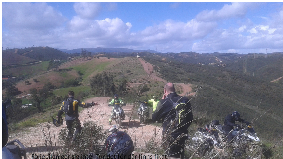
Följebilen ger sig inte, den ska fram överallt. Och det är tur det för där finns fiket.

Nu börjar vi känna varandra lite bättre och genast börjar pikarna komma. På after-bike-ölen säger Norrmannen till Micke: jo du vet orange det betyder ju varning.