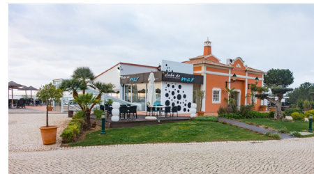
Lägenheterna vi bor i var riktigt fräscha.