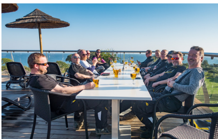
After Bike Dryck smakar bra.

Den här resan skiljer sig väldigt mycket mot dom hoj resorna jag gjort tidigare. Där diskuteras vägval lite hur långa pass vi ska köra o.s.v. Här diskuteras om man ska ha 2,1 kg eller 2,3 kg luft i hjulen, olika däckfabrikat osv.