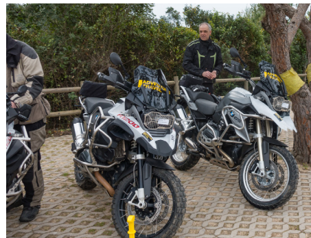
Förberedelse inför dagens övningar.