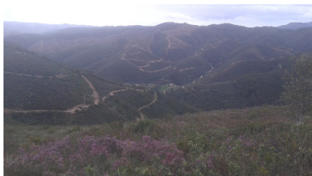
En vy över delar av området vi körde i.

Nu kommer nästa utmaning, ytterligare en backe. Ser inte ett dugg märkvärdig ut, det svänger vänster på toppen som det ser ut. Nu åker Micke före mig och jag hör i