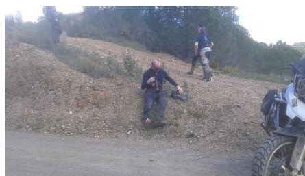
Tömmer vatten ur stöveln. Täta skor och strumpor rekommenderas

Efter lunchen idag så ska vi alla ta oss uppför en brant backe igen. Den andra gruppen åker först men efter en kvart kommer dom tillbaka. Då har det visat sig att turledaren i den gruppen har försökt två ggr men inte kommit upp!!