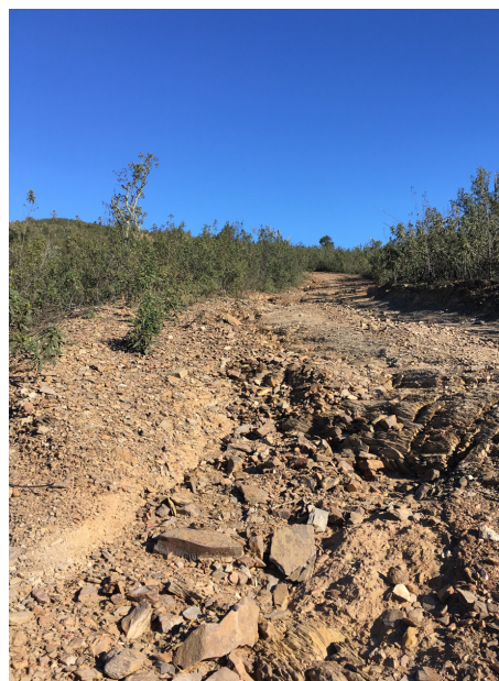
En typisk "väg" med dess rännilar.

I kväll var det en Italiensk restaurang som besöktes. Det blev en pizza.