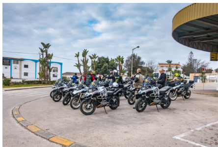
Återsamling efter tankning.

in anmälningsavgiften och nu ringer Micke igen. Jo det var en sak jag glömde, ja ha vadå sa jag. Jo det här kommer att kosta dig 200.000 kr. VA! resan kostar en del men inte på långa vägar så mycket. Jo du förstår när du kommer hem från Portugal så kommer du att lägga ut en annons på Blocket om en KTM 1190 ADV och sedan måste du köpa en ny och jag vet vad det blir, hej då. Kommer aldrig att komma på fråga, min hoj är helt ok inga fel på den. Kardanstång? Det har ju lastbilar, nej jag åker motorcykel jag.