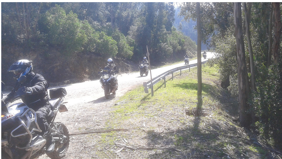
Första dagen bestod av fin asfaltåka.