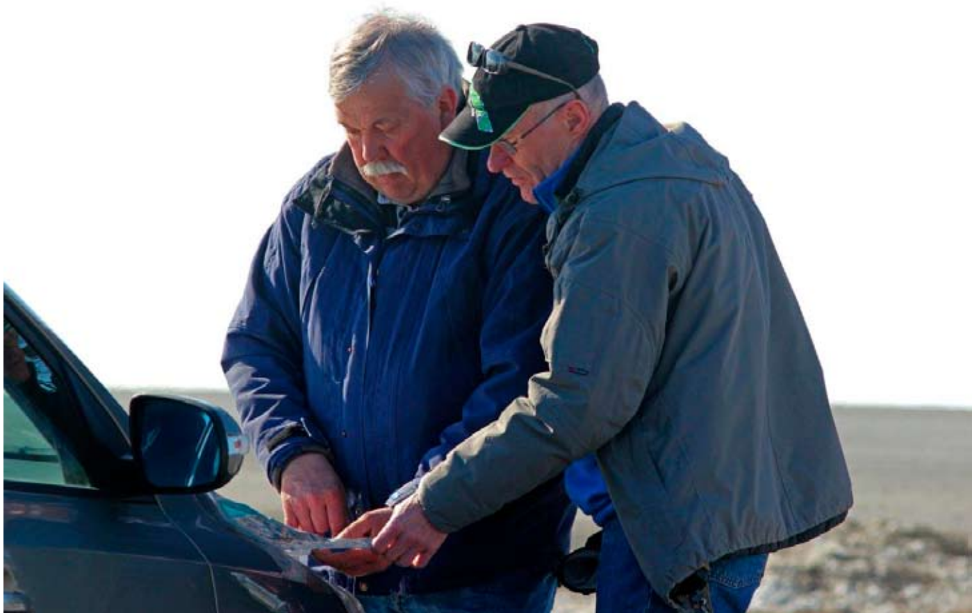
"Men det står ju att vi skulle ha tagit till vänster i förra korsningen. Tog vi inte till höger där?"