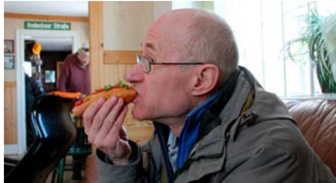
Det bästa med bilorienteringen är varmkorven