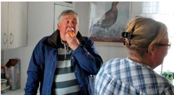
Det bästa med bilorienteringen är varmkorven