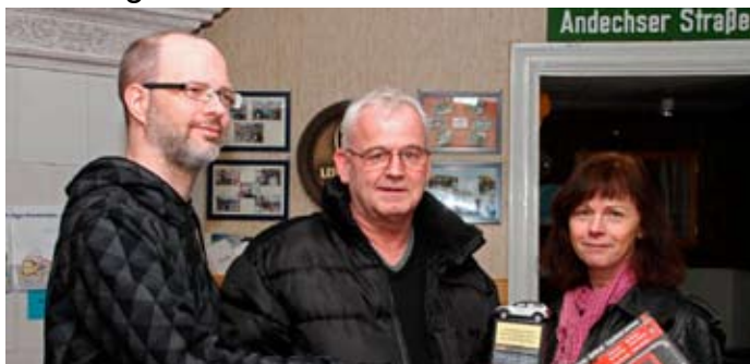
Banläggare & segrare i Bilorienteringen

Lördagen den 16 mars avgjordes årets del-tävling i klubbens Bilorientering. Här är lite blandade bilder från Janne Lindbergs & Anders Bellbrings kamera.