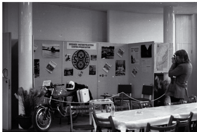
SMC:s utställningsmonter på Teknorama 1972

Rapporten som höll på att stoppa motorcyklismen i mitten av 70-talet