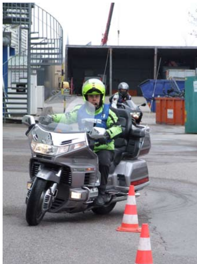
Avrostning för alla motorcyklister

Vi avslutar övningarna med en touring med mål i Östra Aros MCK:s klubbkåk i Stångby. Se till att du har drivmedel så det räcker för dagen. Det finns OK-station vid Bärbyleden ca 200 m från Bilprovningen.