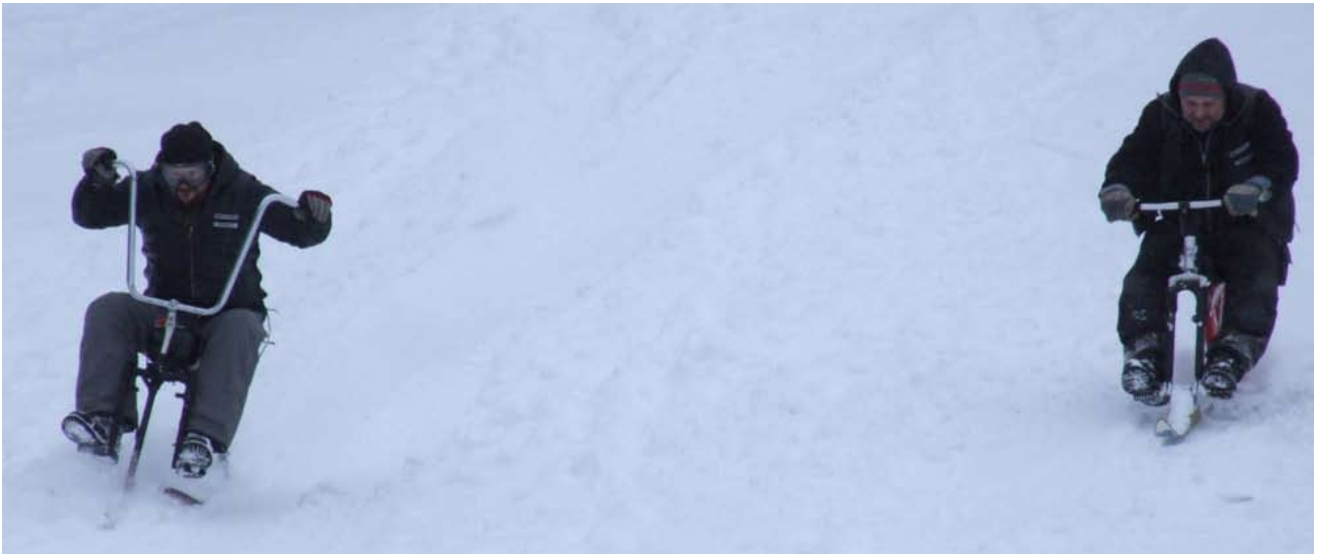
Throttle Twisters båda ekipage tävlade med varandra om segern.

Det var den omedelbara reaktionen bland klubbens närvarande medlemmar efter förlusten på Pulkareiset i Sunnerstabacken förra helgen. Numera finns vandringspriset på väggen hos Throttle Twisters nya klubbkåk vid Librobäck.