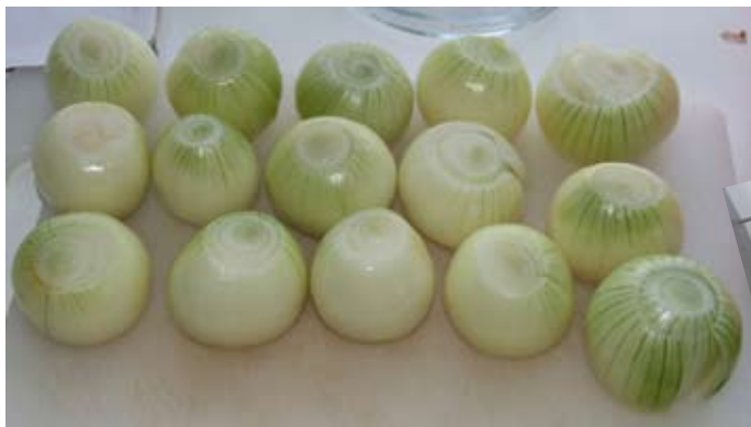
Dom schyssta lökarna hamnade snart i gulaschen

Traditionsenligt var det Bayer-afton kvällen före årsmötet. Men allt är inte fest och glam. Det krävs en del förberedelser i köket innan det blir bra. Mer bilder och text från Bayerafton kommer i vår klubbtidning JERNET så småningom.