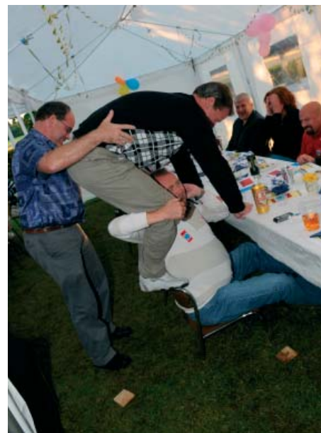
Ola fick plats vid barnbordet. Eller hade det med det envisa regnandet veckan före att göra???