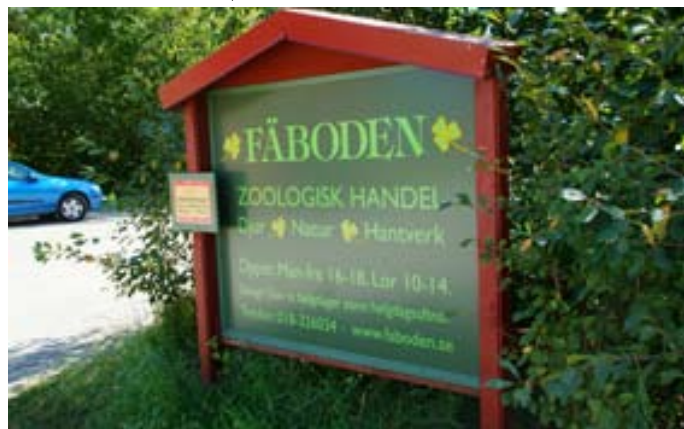
Och här säljer dom naturligtvis - ja vadå?