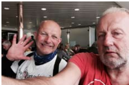
Det blev båt Calais-Dover istället för tunnel pga navigatören (jag) inte såg nåt

gjorde likadant. Snart var dom äntligen klara och det var länge sedan det slutade stänka. Nej, regna det har det aldrig gjort och jag förklarar att "är det på det här viset då börjar ni åka med regnställ varje dag. Vi är i England/Irland nu. Då kanske vi slipper dessa eviga stopp för vid nästa stopp då är det samma akrobatik övning igen fast åt andra hållet liksom".