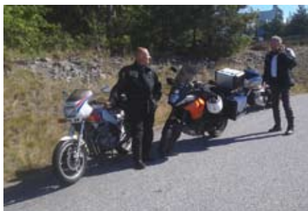
Ett stopp på väg till Göteborg

Planen var från början att vi skulle bo i Galway onsdag till måndag (26/8-31/8) men så kom någon på att det kanske skulle vara bra att bo sista natten i Dublin då "tjejerna" (hur länge är man tjej) skulle flyga hem på måndagen.