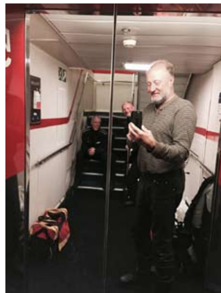
Groupies med spegelhjälp