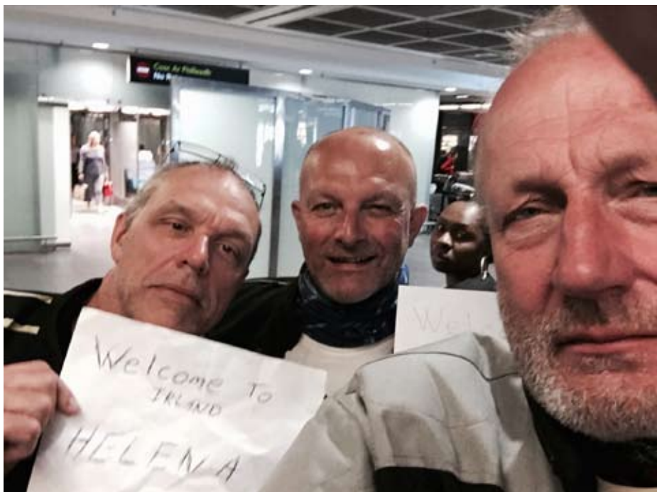
Vi tar emot fruarna på flygplatsen i Dublin