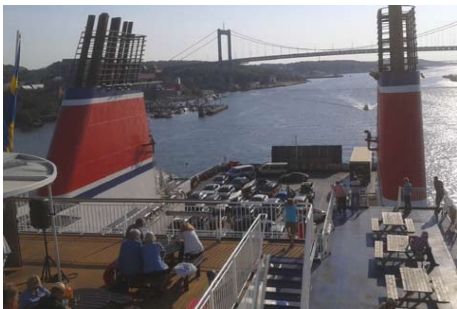
Vi lämnar Göteborg för att vakna i Kiel