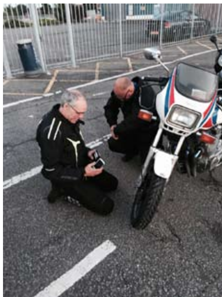
Bromsservice på Yamaha

Det positiva var att alla i kön såg vad vi höll på med och inom kort var hela kön inblandad i att tillverka div sprintar. Problemet är att diametern på sprinten måste vara typ ett gem, inte större. I kön står ett militärfordon som ser helt suspekt ut och vi tänker att dom har säkert vad vi