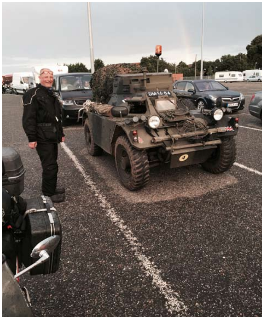
Udda fordon i färjekön

Vi köper det vi behöver och ger oss iväg igen. Nu kommer vi ut på motorvägen igen men tar av efter ett par mil och kommer ut på landsbygden samt åker efter kusten. Vi stannar och fikar samt fortsätter. Tyvärr kommer vi ut på typ motorväg igen och det blir 6-7 mil till på sådan innan vi kommer av den. Nu har vi hittat en fin liten byhåla (Nantwich) med alla faciliteter och vi slutar åka vid 17-tiden och bestämmer oss för att sova här i natt.