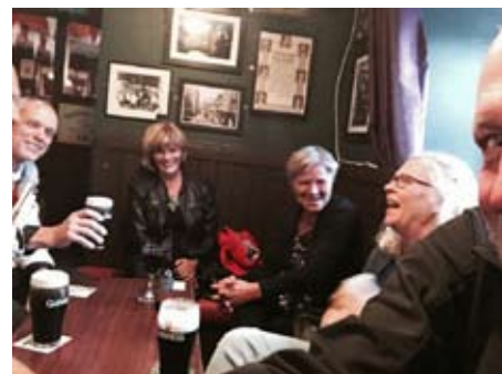
Nu har dom kommit

När vi kommer till hotellet i Galway står (tjejerna) där och vi kom precis lägligt för att våra kreditkort skulle bli drabbade ..... vid incheckningen. Vi har en jätte trevlig kväll tillsammans.