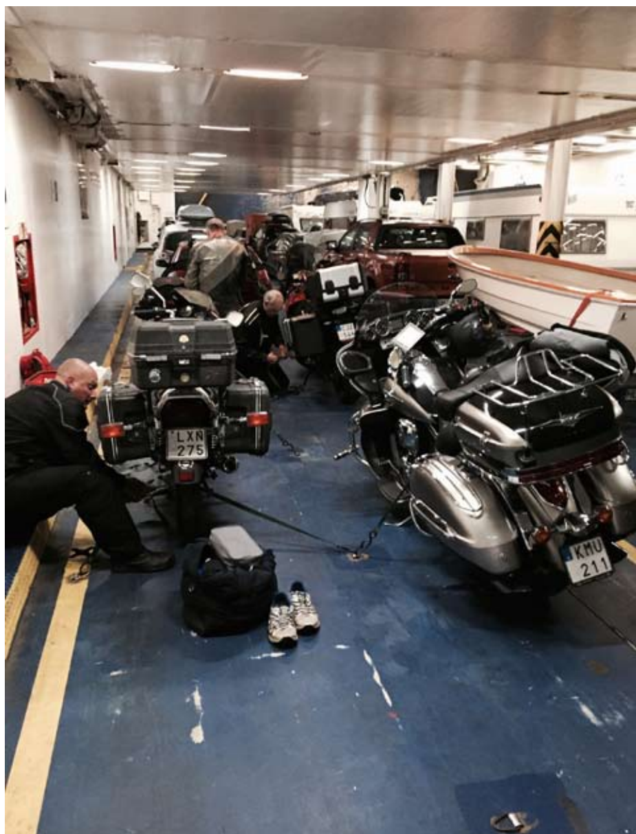
Fastspänning av hojar på bildäck

Vid 3-tiden hade jag fått nog av motorväg och sa att vi måste köra alternativa vägar för att få se något annat. Sagt och gjort vi var nu alltså i Holland och började alltså åka "by-vägar". I.o.f.s. fina mysiga byar och lite lantmiljö men vägen var väldigt smal och heldragen linje i princip hela tiden. Efter 1,5 timmar hade vi kommit 7 mil och vi tog ut på motorväg igen. Ca 17.40 kör vi av vid Breda i Holland och tar in på ett hotell. När vi kör in på parke-